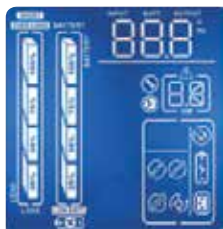
LCD pantalla - Instalación en torre