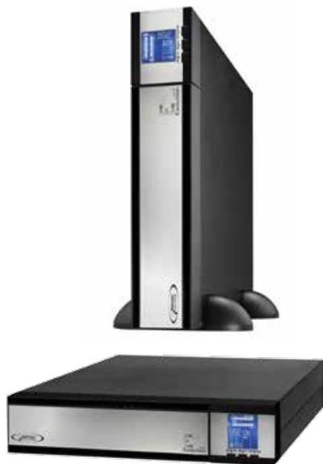
E6 LCD RT EVOLUTION 1000-2000-3000