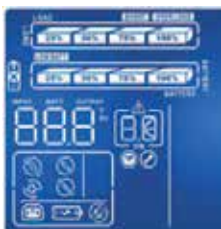
LCD pantalla - Instalación en rack